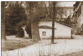
Манастир в мизаното

Обикновено най-старите сведения за построена