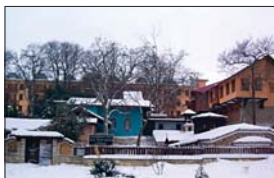
Обич и глед на манастира