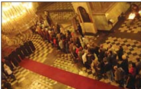
Поклонението през мощите в ИКХХП „Св. Александър Невски“