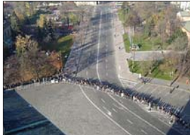
Моществото миряни през катедралния храм, в очакване да се поклонят на мощите