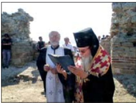
Сивенски митрополит Йоанний благославя възобновяването на проучаваната на остров Св. Иван

На 12 ноември 2010 г. по решение на Св. Синод на БПЦ и с благословението на Негово Высокопреосвященство Сивенски митрополит Йоанний, в чийто домове е хранилището на гръцките мощи бяха транспортирани до София за поклонение в катедралния храм-паметник „Св. Александър Невски“. Мощите на св. Йоан Кръстител бяха посрещнати от архиепископа от Сивенска митрополия, преосвящените епископи и многобройно свещенство при празнично бие