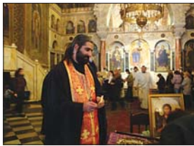
Столичен свещеник покланя при мощите