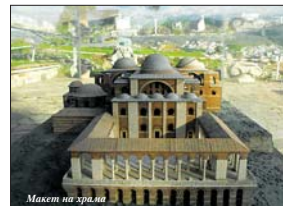
Маяк на храма „Св. Иван Богослов“

Когато преди повече от двавет години изучавахме тези стихове на Вавлон, така и не умях колко е този „Патмос“, а още по-малко кой е строгият пустинник и защо е толкова важен, та посетя да знам. Момче на Панаей си тога. Може ли следва да знаа и това, че следва тук се бда да спомнем тукме в храма на светия, проповядан е на Патмос, а в прославил самия Патмос – св. апостола и евангелист Иван Богослов?