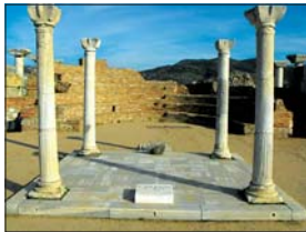
Местото обелязано като „Гроб на св. Иван Богослов“