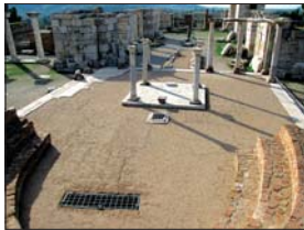
Храм „Св. Иван Богослов“ – изглед откъм олтаря