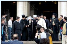
Изпращане на патриарх Максим след Всенационалното Божие