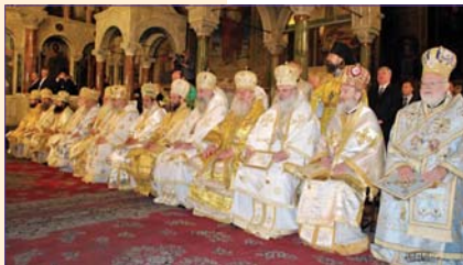
Българският патриарх и Софийски митрополит Максим, предстоятели, предстоятели на Поместни православни църкви, епархийски митрополити, епископи и духовници на БПЦ по време на всеправославната св. Литургия

В събorno единство представляват на поместните сестри-братски от целия православен свят – предстоятели, архиереи, свещенослужители, монаси, монахини и верни чедa на БПЦ – почетна Негово Свeтeйшeство Българският патриарх Максим, който e най-дълго светeлствувалът предстоятел на самостоятелна Православна църква, и се събъра поц култола на патриаршеската катедрала „Св. Александър Невски“ в София, за да вземат участие в официалните празненства по повод 40-годишнината от неговата интронизация.