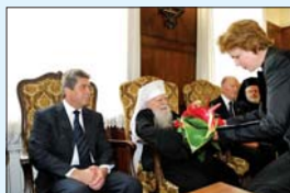
Госпожа Фанджова поздравява патриарх Максим и приемилия силен на Синодната палата