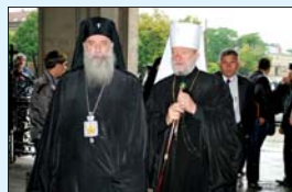
Покръщение на върховете делегация