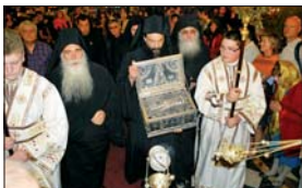
Посрещане на св. мощи в ИКСПИ „Св. Александър Невски“