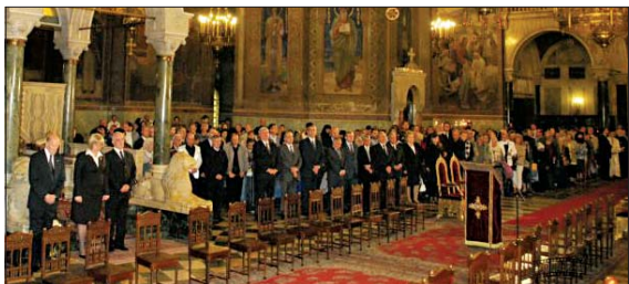
Официалните срещи по време на тържествена св. Литургия

Премиерът Борисов получи от името на патриарх Максим официалния патриархийски знак и юбилейни албум.