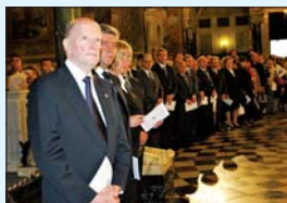
Официалните гости по време на св. Литургия