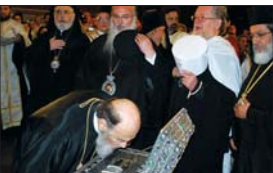
Архиепископ и митрополит при св. десница