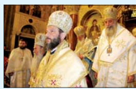
Момент от всеправославната сбирка св. Литургия