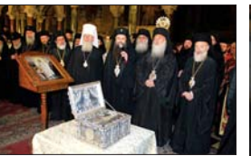
Слово на Пловдивския митрополит Николай при посрещане на св. мощи