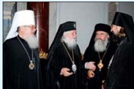
Сбирката архирейски стоджлат радости от празника