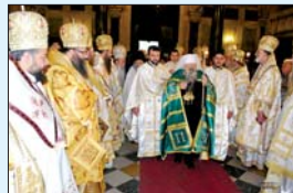
Покръщение на Негово Светейшество патриарх Максим