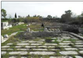
Рuinи на църквата в Милет