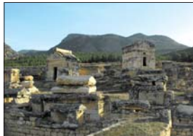
Гробици в Панагидела (Иерапо)