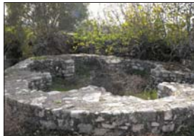
Мартриум до отъпана на църквата