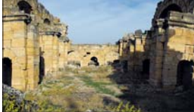
Базилката в бившите терми

П ривиджанахме през о-в Кос (със спирка на о-в Калимос) до Малозантаска при едва ли е нурвало да опиемш подобно... Но като интерес обстоителство мога да спомена, че според пътеводителите именно на Калимос се намират следи от най-големите пазовини „ферми“ за отглеждане и добия на морска гъби („сонтери“). Тази информацията изглежда беше важна, понеже в пристанциния град на островче се натъкнаме на множество складове-магазини за сортиране, пакетиране и продажба на тази стока – на сур и дребно. Освен привоженето ни в банята от дреността до днес, морските гъби са несомнено и в православното боготъжество – една за послушание на св. петер след св. литургия, и друга (сплесната) – за почитане на св. антимон от нападато по него частии, както и за склагане на по-древните тамина от св. дикее в литургия. Това же накарна да се възползам от възможността и да закупя нови гъби и за нашия храм, още повече, че имах възможност да изберам между стотии.