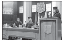
Вечерта сесии в пленарната зала на Община Варна

Седмицата на православната книга се организира от 1998 г. с благоговешно-