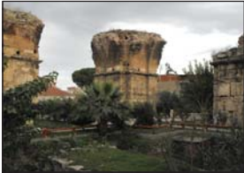
Останките на храм „Св. Иван Крстивител“ във Филаделфия (Азбакистан)