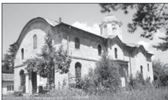
Храм „Св. прот. Параскева“ – гр. Бяла Слатина

През 1943 г. отен Георги е отзован и се връща във Врачанска епархия. Получава изключително като снорийски свещник