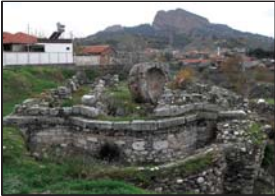
Останките на многоетажната църква в Сарби