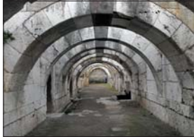
Покритата гора на Смирна (Измир)