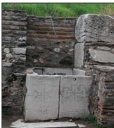
Чемпи в кръстове в Сарби

След не повече от 50 км беше следващата ни спирка – Саргматум или само Сарг, западна в името си корена на древния Сарг. Историата на последния западна много време преди Р.Х., а аногос на славата си този достига, когато става столица на лидийските царе. Най-продължител се от тук с Крез, който заради голямото си богатство с станал наричателно за заможен („Богат като Крез“). Малко известно е обаче, че този човек с име, станал символ на земно богатство, завършила живота си трагично – след като загубил войната с персите, бил изгорен на клада от собствената си народ. Останките от древни здания, пред които най-