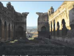
„Червената Олп“ – дясно на иконостаса базилика „Св. Иоан Кръстител“ в Перелия

През II в. след Р.Хр., т.е. успоредно с свангелската проповед, бил построен внушителен храм на Серапис (естно от главните египетски божества) в полвоието на Акрополта (вероятно горе на запад) в негово име. Неговите високи червени стени, издигнати от тухли, и до днес се висяват на повече от 10 м над земята. Впрочем, това беше и първата ни спирка. Може би някоя ще се учуди, че споменах тази сграда като част от християнското минало, но в ранното Средновековие (когато ми към V-VI в.) между стението на „Червената зала“ (както е обозначено на табелите, всъщност към нея) се е поместила трикорабна базилика, посветена на св. Иоан Кръстител (тазова се нарича още „Крмисмова базилика“). Изградена е скъпо от износната с мраморни блокове крадън земя – в двата ъгъла на външните ѝ стени имаша имената на главните Пергамски мъченици св. Кърел, дякон Папила, Атанатика (неговата сестра) и Агагатор († 13.Х.), пострадали при говеието на Деци (III в.).