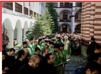
Дай ми, блажени, крепка помощ, още и просвещение на разум, за да овладя моя раненоселен живот на земята, с който си се показала избор на чудно.