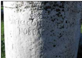
Колоната на св. цар Константин Велики в Троя