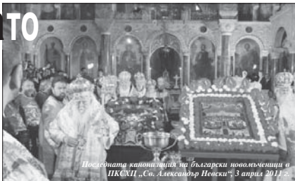
Познатата кавалерия на български пономъченици в ПКХЛ „Св. Александър Невски“ 3 април 2011

Обядо е, се течешие потомци са ги забравили. Кой десе знае за: 1.II. (нов стил), „Ангелъ воишъ възл.“