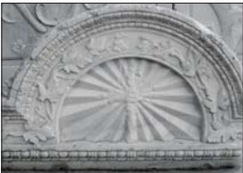
Фрагмент от църковна украса в Перелия със заличен апосподостен кръст