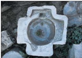
Кривошия кулест от Перелия