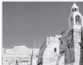
Витлеемската «Рождество Христово» във Витлеем, издигната от св. император Константин и майка му царица Елена върху яслисто, което се нарича Рождественската пещера

На Светите земи до днес, точно както и във времето на Христос, стои камчатата пещера във Витлеем, в която се е родил Спасителят. Господ обаче познавал окаменелите човешки сърца и съмнявания се човешкия разум и свързал най-важните събития от земния Си живот с неразрушими силки, онезеля до днес.