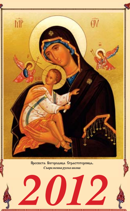
Пресвета Богородица Страстотерпица. Сърбелена руска икона