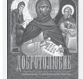
Творци във на книгата, и живяване на светогорския монастир „Св. авлч Гери Зоарф“

Самото съзидание за това, че носим живота, или че ние е дадена сила да димаме, имат да ни заредат с жажда за онова съзидание на любов, което изба-