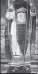
Св. цар Борис. Книжорско изображение от Микенския дворец, Митоп Оряховица

От отговора на папа Николай I стана ясно, че той не одобрява крайнопротозънолюбивото потупване на бунта, но пояснява, че „...вие сте съгършени от ревност към християнската вяра... вие добивате за това опрошение и милост по благоволеносте на Христа, шом поседва от ваша страна покаяние“. Кой тогава стана в освоената на тървенията, ос