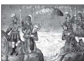
Знаменитата среща между св. Йоан Римски и св. цар Петър. Стенопис, XIX в., църковна „Св. Петър и Павел“, митоп Оряховица

вни на русите и разпространение на богомилската ерес. Той няма нито една бласкав победна бойното поле, но остава исторически като младшият дипломат, успял да постигне 30-годишен „дълбок мир“ на средновековна България с Византия. Цар Петър допринася за укрепване на православия в България – смятан е за едина от най-значимите фигури в духовния живот на цялото българско средновековие. Благодарие на него през 927 г. България