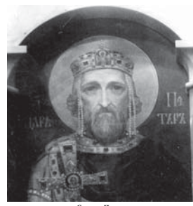
Св. цар Петър. Стенопис от триптери на Патриаршеската катедрала храм-памятник „Св. Александър Невски“

Съвременниците му го просят като „боголюбива и досточуден“, „най-добър и най-протур“, „твърд камък на вярата Христова“. Канонизиран за св. светицар е обявен на 30 януари 970 г. От много дареши времента той е наречен светец в българската летопис от XI в. в гробищата на цар Константин Асен от XIII век, а житието на Зографските предобноименници от същия век, а известния „Пролог“ на Станислав от XIV в., а Драгановия „Именник на българските царе“ и пр. До наше време се запазили неговите служби, съставени и неговата чет, навярно към края на X век: едната е собственост на българс-