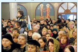
Богомолният народ в храма