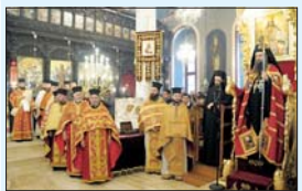
Сборна св. Литургия в храм „Св. Мария“