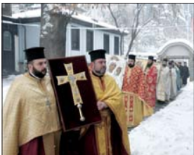
Высказ на светините в храма

Чудотворната икона на Божията Майка, наречена още „Рабната“, се намира в църквата „Пресвета Богородица – Благотворение“ в Асеновград. Според хрониките на храма чудотворната икона на