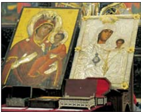
Икоя покровна на светините

От стр. 1 Кръстова гора, чудотворните икони на Пресвета Богородица – „Рабната“ (Асеновградската) и „Златната абылка“ от Горни Воден. Редом с чудотворните икони в храма била поставени и икони свети мисли, които се поклонт в епархийската център.