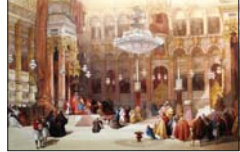
Съборният храм „Св. Въркесие“ на Божия Гроб (фотография, 1839 г.)