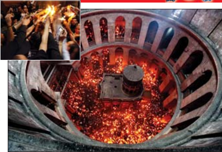
Благодатният огън в Ротондата „Св. Възкресение Христово“, 23.04.2011 г.

Утрото на свещената Пасха отечески поздравяваме всички верни чедо на светата наша Православна църква – в