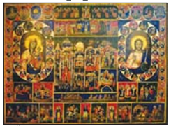
Йерусалим, 1893 г. (те.опера, платно)