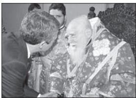
Негово Светейшество патриарх Максим дава благословение на президента Росен Плевнелив

Там рече затворените храмови оти прокува 7-10 на 23