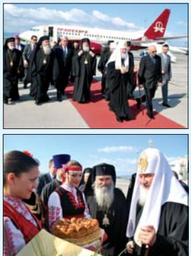
Посрещането на Руския патриарх Кирил на летище „София“