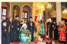
Двамата патриарси по време на молебен в Пловдив