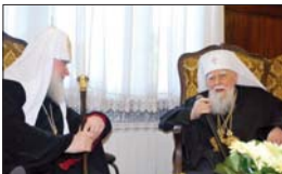
Срещна-разговор между двамата патриарси