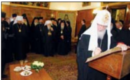
Руския патриарх Кирил основа палатата бележка в почетната книга на Синодалната патриаршия