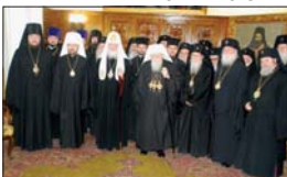
Обла съставя в приемния салон на Синодалната палата на архидякоте от Св. Синод и официалната руска делегация