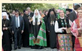
Литийно шествие през центъра на гр. Пловдив