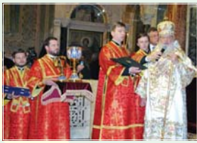
В края на св. Литургия едината патриаршия си разделилата дворовети в отново историческата срещна и братското същеление

В свиянето на светлата Пасха Христова, друг друга обичаме и тако рием: Христос възкресе из мертьви – Възкрисе воскрес Христос! Амин. 29.04.2012 г.