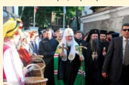
Посещение в двора на храм „Св. Марина“