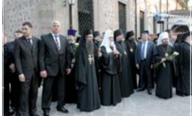
След края на мълченица официалните гости се отправиха към митрополитския дом, където домакините даждоха прием. В двора те бяха посрещати от фолклорния ансамбъл „100 каба гайди“