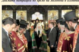
Патриарх Кирил благославя българското свещенство