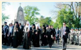
Поклонение на хълма на Освобождителите