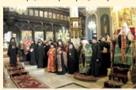
Молебен в митрополитския храм „Св. Марина“