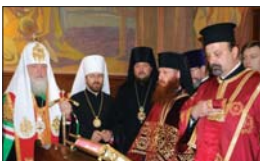
По време на молебена в синодалния параклис

Заедно с духовниството в синодални параклиси се молиха за преуспяването на двата братски народа – българския и руския, и на двете Църкви – Българска-