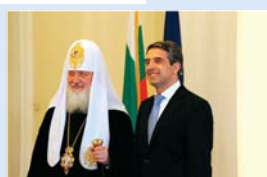
Срещя с председателя на Р България Росен Плевнелиев