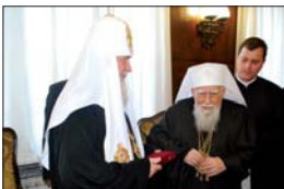
Врчването на орден „Св. цар Борис“