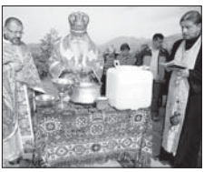
На 21 май Негово Високосвещенство

Между Стара планина и Средна гора един малък параклис се възвишава над околните поляци. От това място погледът спира в склоновете на весте български планини и кара наблюдателя да се замисли за Създателя на тези дивни земни красоти. Параклисите, намиращи се между селата Мирково и Самоков, Паранска дунавска околина, се покланят на св. равноапостолни царе Константин и Елена. Това е притегателно място както за местните, така и за всички, които преминават от тук.