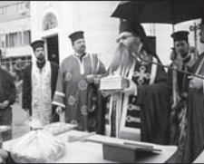
Молбени са предостанови от Негово

В тези дни, когато София чества паметта на двама софийски мъченици на врата – с. Георги Най-нови и с. Терапонит, се благоуважава на Негово Превосвещенство на Българския патриарх и Софийския митрополит Масакия Софийска епархия започна да се извършват молбени от поклонниците на Великия вярващ за всички поклонници на вълоните прогресии и улавяния вършачи от земетресенията през последните дни. Чете се почитателно и „Канон при опасност от земетресения“, както се състои от три молитви със стихове, определени да се четат винаги при земетресение или когато има опасност от такава.