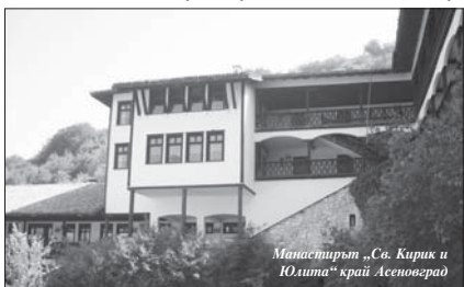
Манастирът „Св. Кирик и Юшма“ край Асеноваград

Архиепископът се жалвал, че неговите инициативи и начинания не сре-