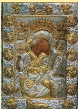
Икона на Пресвета Богородица „Достойно естъ“ – българска