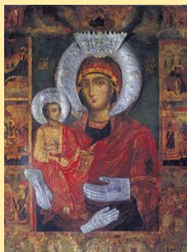
Троянската икона на Пресвета Богородица – „Троеруцица“

Блаженопочиналият и приснопамятен Български патриарх Максим бе призован няколко пъти преди да преседе Божу дух. На 27 октомври 2012 – 1 час след идването на тоचното копие на иконата „Достойно естъ“ – се появи първото съвременно петно на дванайсет страни на лицето на св. Богородица. На 28.10. още само петно и на 30.10. общо 5 петна. На 5.11. започнаха да се изчистят и на 6.11. стурината вече образът бе отново чист. Значи точно след като почина. За нас това означава, че св. Богородица плаче на небеса, скрива за него и когато почина, го винаги при себе си и петната се омекват, поради което се утешаваме, че Патриарх Максим духовно е с нас и пригиза се бъде.