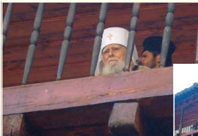
Светиешкият патриарх благославя за последен път любимото си наство в Троицкия манастир на празника Успение Богородично, 15 август 2012 г.

От земјата на българите нај-старинат измежду правосветителствата на фамилијата Православна простра рџдет на својата молитва на Изток и на Запад, на Север и на Југ и јави