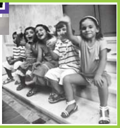
Децата са част от семейството. Трябва ли съпругът да помага на своята съпруга?

Действително, съществуват различни организации, фондации и т.н., които се занимават с пропаганда на нездравия отношения между половеи и тяхната „работа“ сериозно се финансира, което означава, че в бъдеще ще се срещаме с тази проблематика.