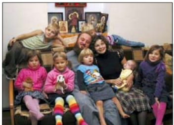
Цялото семейство се събира за празник. Трябва ли съпругът да помага на своята съпруга?

Пак ще кажа, че това разделение на мъжа, който работи и печеи, и на жената, която се грижи за домакинството, е нецдо погрешно и неуместно. Трудно е да го отгледят дори на елементарно ниво: цом съпругът не присъства физически в семейството, цялостно е, че той няма да може да го ръководи, нито пък