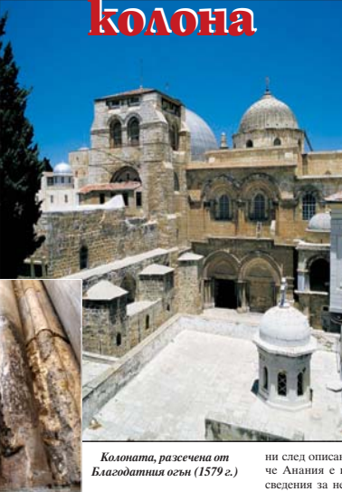
Колоната, разсечена от Благодатния огън (1579 г.)

до една от неговите колони. И изведнъж, когато настъпила нощта, колоната била ударена от светлинна мълния и Благодатният огън започнал да се излия от нея!