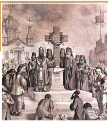
Идеята на българския духовен водач

„законот поемат за изменение и го въвеждат на Екархийския устав“