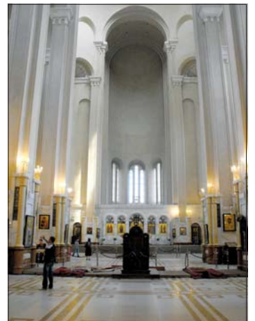
Патриаршеската катедрала „Цминда Самеба“ (интериор)