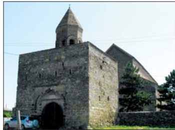
Базилката в Урбниси