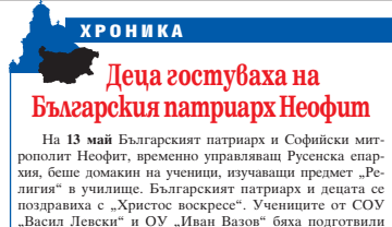
Деца гостуваха на Българския патриарх Неофит

На 13 май Българският патриарх и Софийски митрополит Неофит, временно управляващ Русенска епархия, беше домакин на ученици, изучаващи предмет „Религия“ в училище. Българският патриарх и децата се поздравиха с „Христос възкресе“. Учениците от СОУ „Васил Левски“ и ОУ „Иван Вазов“ бяха подготвени