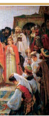
Църковната автокефалия и българския архиепископ получил титлата „патриарх“

Константинополската патриаршия. Същевременно Охридската архиепископия била подложена на емиграция (погърчаване) – висшият клир се получавал предимно от гръцкоезични византийци, а за митрически и канцеларски език бил введен гръцкият. Създадена по този начин Охридска архиепископия, която била приемница на Първата българска патриаршия, станала единствена опора и утешителка на целия български народ през бившо дветековно византийско владичество.