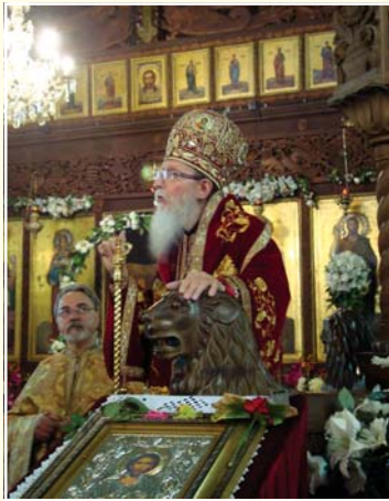
Хорната слепота е невиджана на доброто и виджана на злото. Виджана не по православниому. [...] А страданиято ни прави милосърдни, умилва ни, насочва ни към усърдна молитва. Страданиято за нас е духовен лечител, който винаги може да ни помогне.

Докато той, страдащият, прогледал телесно и духовно за радост и утеха на Всички повярвали в истинския Месия. Защото освен телесна, има и духовна слепота. Ду-