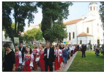
Парадно шествие на гостуващите хорове от храм „Рождество Богородично“ до централния площад