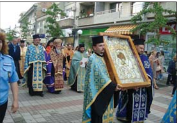
Тържественото пренасяне на иконата до храма долакич „Рождество Богородично“