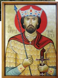
Храмът „Метехи“ и икона на св. цар Вахтанг

пълно презрение към своя мъж – богоотстъпник. Не можейки да търпи това, в гнева си той така жестоко я пребил, че след това дни наред тя не можела не само да стои, но и да се храни. След малко затишие, по време на Страстната седмица Васкен отново се вбесил и я извлякъл насилно от църквата, влачил я до двореца през тръни и камъни, а там по негова заповед я пребили с тояги. След което едва жива я оковали в тежки вериги в тъмница, където я морили с глад и жажда.