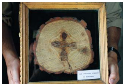
Срез от бора с кръст в сърцевината

С интерес слушахме Нино – че „Метехи“ е посветен на св. Богородица, че сегашният храм бил построен през XIII в. на мястото на по-древен и т.н., но нямал търпение да влезем вътре. Св. Шушаник (името в превод значи Лилия) бе една от първите грузински светици, чието житие бях прочел и сега изпитвах голяма радост, че сме тук – при нея. А житието или по-точно мъченичеството ѝ е наистина потресаващо, ревността и духовната ѝ сила – изумителни. Тя живяла в V в. и била дъщеря на Ранския цар, омъжена за негов васал – Васкен Питахши. Последният обаче, вероятно по политически причини се отрекъл от християнството и приел персийската религия