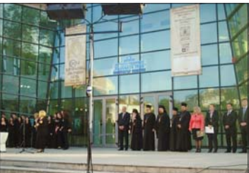
Момент от удостояването с грамоти и плакети на хората, допринесли през годините за провеждането и популяризирането на фестивала

положена за поклонение в храма долакич „Рождество Богородично“.