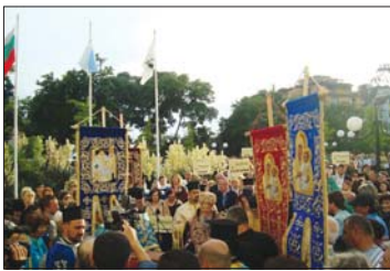
Моленба пред иконата „Достойно естъ“ при откриването на фестивала

Но ние, човеците, сме твърде нетърпеливи и в малкото, и в голмото. Защото страдаме от блиски и от далечни, и от завистливост. Св. Йоан Златоуст казва: „О, завист, ти си коренът на смъртта! Ти си най-острата игла, която се забива в сърцето на човека и не преминава до края на живота“.