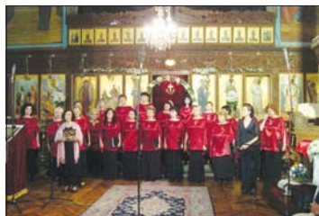
Женски хор „Христина Морфова“ при наорно читалище „Др. Петър Берон“, София