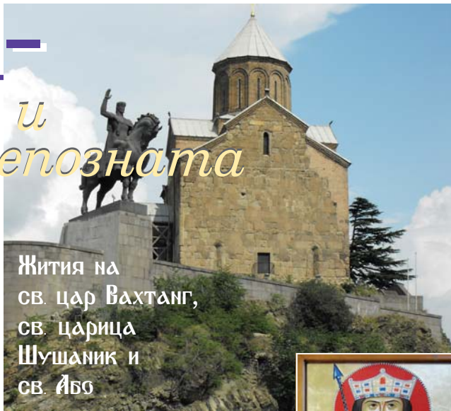
Жития на св. цар Вахтанг, св. царица Шушаник и св. Або

Първият католикос на име Петър бил грузинец от Кападокия. Царят построил множество църкви и манастири, от които най-вече издигват манастира „Св. Кръст“ в Йерусалим – на място, дарено от св. Константин Велики още в IV в. на св. цар Мириан (покровителя на грузинците). Обителта се издигала на мястото, където според преданието Лот посадил три клонки – кедър, бор и кипарис, които израснали и сраствайки се, образували