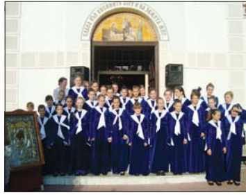
Девически хор при Успенския храм на ср. Красногорск, Русия

Последва заключителният концерт на участниците, по време на който бяха обявявани отличените от журито хоробе. А. ХРИСТОВА