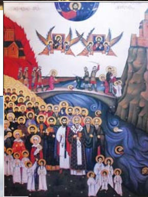
Св. Тбилиски мъченици

Павираната уличка, по която вървахме ни изведе до необичаен паметник – бронзова фигура на седнал човек с рог в ръка. Екскурзоводката ни обясни, че това е „тамада“, т.е. началникът на пира,