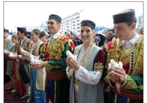
Освещаване на новоизградения храм, въздигнат в чест на Христовото Възкресение – Подгорица, Черна гора

На 6 октомври, неделя, тържествена света Литургия бе отслужена от Негово Светейшество Вселенският патриарх Вартоломей в съслужение с Техни Светейшества: Йерусалимският патриарх Теофил, Руския патриарх Кирил, Сръбския патриарх Иринеи, с Техни Блаженства: Кипърския архиепископ Хризостом, Гръцкия архиепископ Йероним, Полския архиепископ Сава, Албанският архиепископ Анастасий, с Негово Високопреосвященство митрополит Симеон, наместник-председател и местоблестител на престола на Чешката православна църква, както и с представители от останалите сестри православни