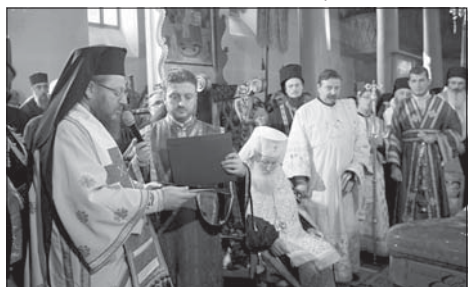
След оелото бяха прочетени съболезнователни адреси

Бог да го прости! Вечна и блажена да бъде паметта му!