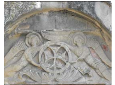
„Възнесение на Кръста“

вярно е била до 736 г., когато арабският завоевател Мурван Кру я превзема и разорява. В началото на XIX в. един руски