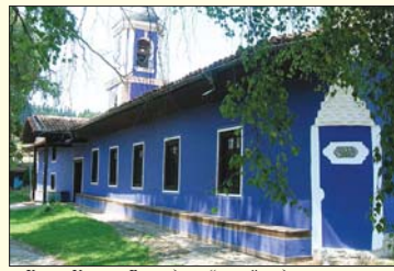
Храи „Учение Братство“, в чийто двор се намира ерба на архимандрита

Основополагащ е приносът на проф. архимандрит Евтимий за развитието на богословските дисциплини Християнска апологетика и История на религиите. Изключи-