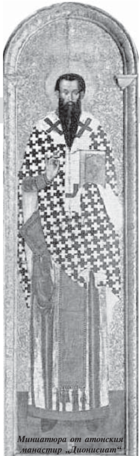
Миниатура от атонския манастир „Дионисиат“

Свети Василий в своето светителско служение като архиепископ на Кесария Кападокийска води и множество полемични и догматически спорове в защита на Православието и Никеиското вероопределение и произнася много проповеди, беседи и нравоучителни слова за духовно укрепване на своите пасоми. Полемиката му е насочена главно срещу арианите и евномияните и има за цел да утвърди Никеиското изповедание на вярата в Сина Божий,