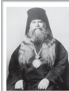
На 13/26 февруари 1950 г., преди 65 години, се упокоява в Господа един от духоносните отци на нашето време – Богучарски архиепископ Серафим (Соболев). Мъдър и всеотдаен пастир, който с пълна саможертвеност служи на Бога и поверено му паство. Еднакво обичан и от своите пасомо от руската емиграция, и от многобройните българи – духовници и миряни, приели архиепископа за свой изповедник и духовен наставник, архиепископ Серафим и след кончината си не е оставил своите чеда – не оставя ничия молитва нечува, ничия болка без утеха, ничия съгласна неустрига.

Започва една много смешна сцена. Той казва: „Разкажи ми греховете си“, на което аз, 17-годишната глупачка, казвам: „Ами аз нямам грехове“. Той ме гледа усмихнато с тези топли очи и казва: „Надя, Надюшенка, но няма безгрешен човек“, а аз казвам: „Как да няма“ и започвам на пръсти да си казвам 10-те Божии заповеди. Първата заповед – нямам грях, втората... Той започва да се смее топло, ласкаво и казва: „Запомни, че няма безгрешен човек!“ Следващият въпрос, който ми зададе, беше: „Каж ми какво ти пречи“. Той искаше да разбере дали мразя някой човек, дали мразя нещо в средата си. Това беше много същностен въпрос и до ден-дневен му се възхищавам, че ми го зададе. И аз казвам: „Сама си пречиш“. „Ами защо си пречиш?“ Казвам му: „Ами