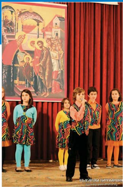
Трябва да бъде изключително полезен. Трябва онзи, който го използва, да притежава опит“.

„Той често трябва да прибегва до различни трикове, да го може чрез изкуството на педагогиката да доведе до голяма полза“.