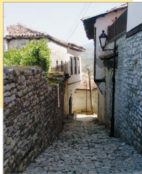
Типични улички на укрепения град Берат