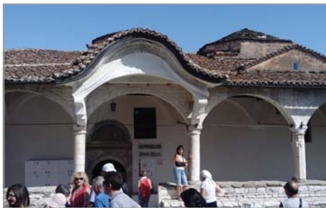
Църквата „Успение Богородично“ в крепостта Берат