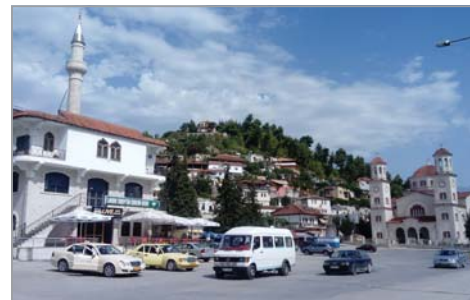
Централният площад на Берат