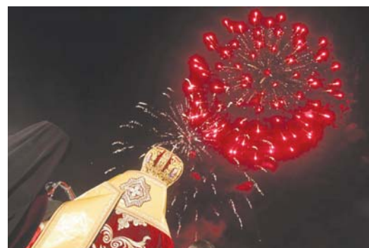
След дните на съкрушение настана ден на радост, веселие и озарение – Великден Господен

На нас не ни е дадено да знаем „времената и годините“, които Бог е положил „в Своя власт“ (Деян. 1:7). Ние обаче добре знаем, че „един е Господ, една е вярата, едно е кръщение...“ „Добре знаем, че „един е Бог и Отец на всички, Който е... във всички нас“ (Еф. 4:5-6), както и че Този Бог „не е създал смъртта и не се радва, кога гинат живите“ (Прем. Сол. 1:13). И тъкмо затова имаме нашето задължение – като Божии приятели и Негови съработници – всякога да свидетелстваме за Него и за Неговото Възкресение, с което бе положено началото и на нашето спасение!