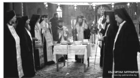
Панихидата на 40-ия ден, 25.05.2016 г.