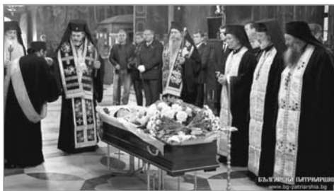
Погребението в Рилския манастир, 4.05.2016 г.

На 7 декември 1954 г. в параклиса на Духовната академия „Св. Климент Охридски“ е постриган в монашество с името Симеон от Ловчанския митрополит