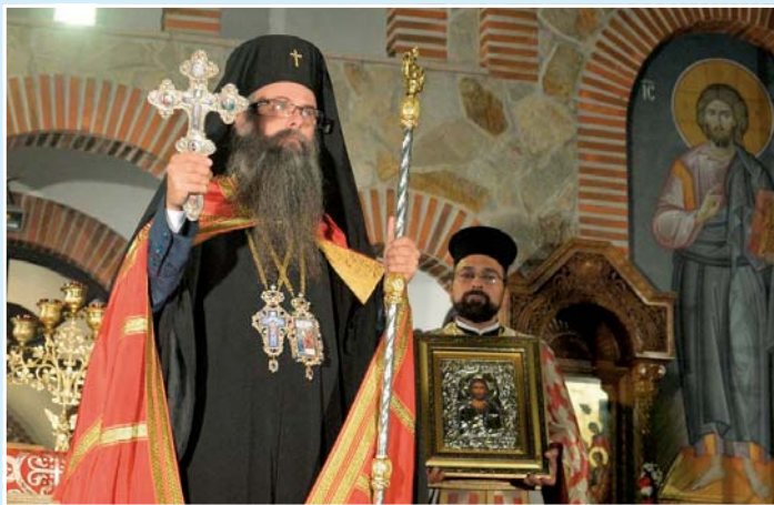
Тропар на св. Кръст Господен, гл. 1

Фоторепортаж от богослуженията при манастира „Света Троица“