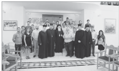
Паметна снимка с Негово Блаженейшество Анастасий, патриарх на Тирана и цяла Албания

Обсъждаха се и нови насоки за осъществяването на дейността на организацията. Главната задача на всички членове на Асоциацията ще бъде да допринесат всеки в своя-