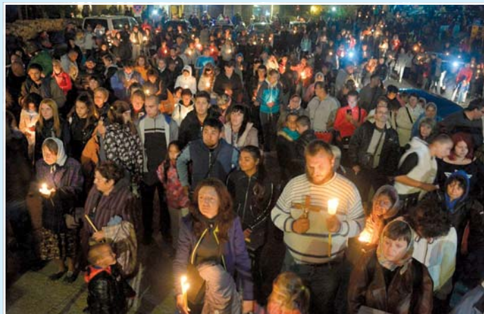
Кондак на св. Кръст Господен, гл. 4

Спаси, Господи, Твоите люде и благослови достойнието Си, като дарявай на православния български народ победа над противниците и ни запазвай с Твоя кръст.