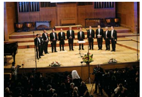
Камерен ансамбъл „Св. Йоан Кукузел“