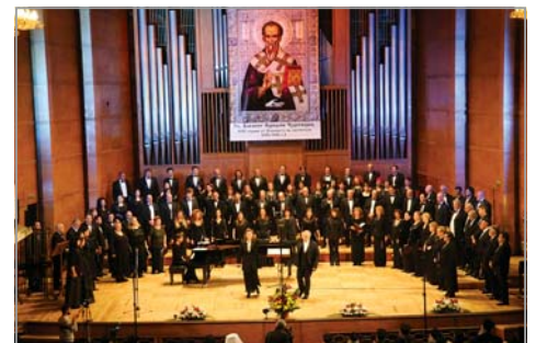
Смесен хор на БНР и НФХ

ЗАПОЧНА АБОНИРАНЕТО ЗА „Църковен вестник“ за 2017 г.