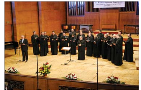
Софийски свещенически хор