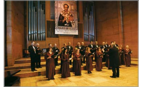
Смесен хор при ПКСХП „Св. Александър Невски“

На 25 ноември, в чест на 1100-годишнината от успението на всеславянския учител, книжовник и архипастир св. Климент Охридски Чудотворец, в най-представителната в столицата музикална зала „България“ се състоя тържествен духовен концерт.