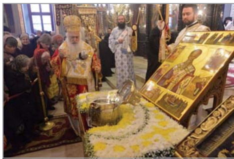
Троянски манастир, Бранички Григорий – викарий на Софийския митрополит, Белоградчишки Поликарп – викарий на Видинския митрополит, Знеполски Арсе-

Съборната св. Литургия беше възглавена от гостуващия митрополит Пантелеймон в съслужение с митрополитите: на САЩ, Канада и Австралия Йосиф, Великотърновски Григорий, Ловчански Гавриил, Пловдивски Николай, Варненски и Великопреславски Йоан, Неврокопски Серафим, а също и пресвещените епископи: Велички Сионий – игумен на