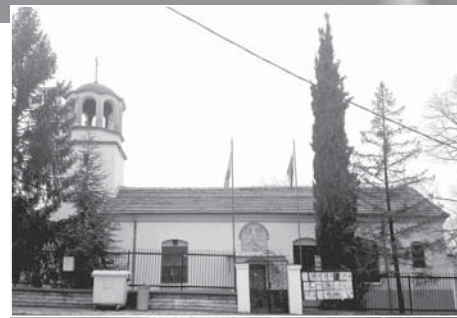
Храм „Св. Кирил и Методий“, с. Долни Воден