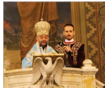
„Туй да светне пред човеште светлината ви, та да видат добрите ви дела и да прославят Небесния ваш Отец“

Отец Сергей пише: „Празниците минаха с повишено религиозно чувство. Започватки от Велики четвъртък вечерта и чак до Втория ден на Великден