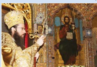
Празничната св. Литургия в храма на Руското подворие „Св. Николай“, възглавена от Знеполицки еп. Арсений