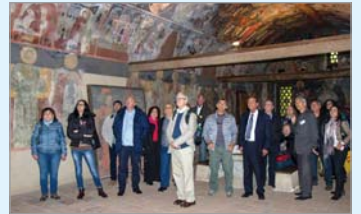
Участниците в конференцията на поклонение в Бачковския манастир

Със своята решителност и последователно следване на библейските и нравствени идеали Българската православна църква възлюбва българската общност за съпротива срещу прилагането в страната ни на закони, дискриминирани евреите. Във форума участваха известни учени от България, Израел, Германия и САЩ с доклади, в които бяха обхванати проблеми от различни области: история, богословие, архивистика. Акцентът бяха върху ролята на СВ. Синод на Българската православна църква за спасяването на българските евреи като проява на действен хуманизъм и защита на свещения характер на човешкия живот. Конференцията имаше за цел, от една страна, обективно и безпри-