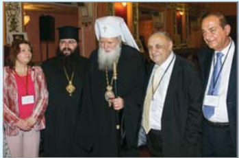
Патриарх Неофит с гостите от Израел

Международна конференция на тема „До съвестта на вярата и по дълга на гражданската свобода – Приносът на Българската православна църква за спасяването на българските евреи“ се състоя на 25 май във Военния клуб – София. Лично Негово Светейшество Българският патриарх Неофит удели организаторите и участниците в конференцията и им предаде първоцветието си благословение. „Добра възможност да поменем с благодарност имената на всички наши достойни предшественици, допринасящи с думи и дело за спасяването на българските евреи“ – нарече той инициативата и подчерта, че „любовта е велика сила и ние няма да престанем да се стремим, да сме творци на мира и носители и проявители на тази християнска съвещателна любов“. „Винаги ще бъдем ваши приятели – обеща с патриарх Неофит към гостите от Израел, – а никой няма любов по-голяма от