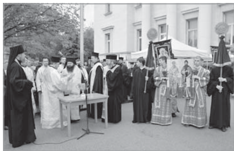
Водосвет при паметника на св. братя Кирил и Методий пред Националната библиотека

„Всички те доказват, че за нас, българите, нашата принадлежност към Църквата на Спасителя Христа е