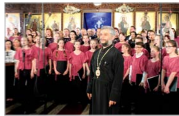
Председателят на фестивалната комисия Старозагорски митрополит Киприан със Сборния хор „Достояно естъ“

Празничната архиерейска св. Литургия в храм „Рождество Богородично“ бе възглавена от Неоиво Високопреосвещенство Сливенски митрополит Йоанкиий, в съслужение със Старозагорски митрополит Киприан. В богослужението участваха още ик. Кирил Попов, ик. Петър Василев, свещ. Емилян Михайлов и гостуващи свещеници.