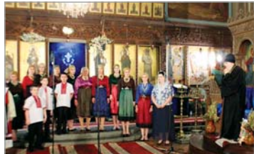
Смелен църковен хор „Чешма варушта“ при храм „Св. Димитър“, с. Кринично, Болгарски район, Украйна

Той стартира с уникалните по рода си източноправославни изпълнения на семейния хор от български произход „Чешма Варушта“ при храм „Св. Димитър“, с. Кринично, Болгарски район, Огоста общ., Украйна. Из свободно отворените уста се носеха песнопения с богата българска фолклорна окраска, унаследена от техните прабаби и майки. Тафтените сукиани, лаптите (ковани ко-