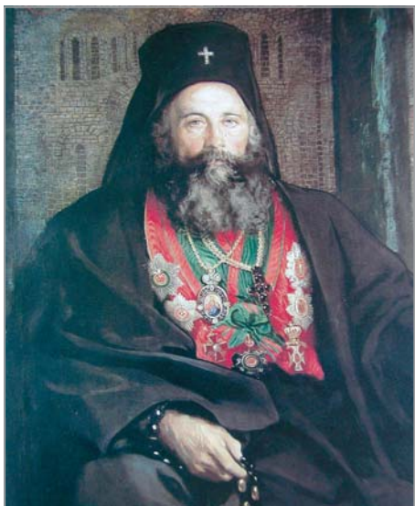
Екзарх Йосиф I

Починалият на 20 юни 1915 г. екзарх Йосиф I бил погребан на 25 юни „с една небивала до сега тържественост“. Нека проследим тази траурна тържественост от страниците на тогавашния църковен печат.