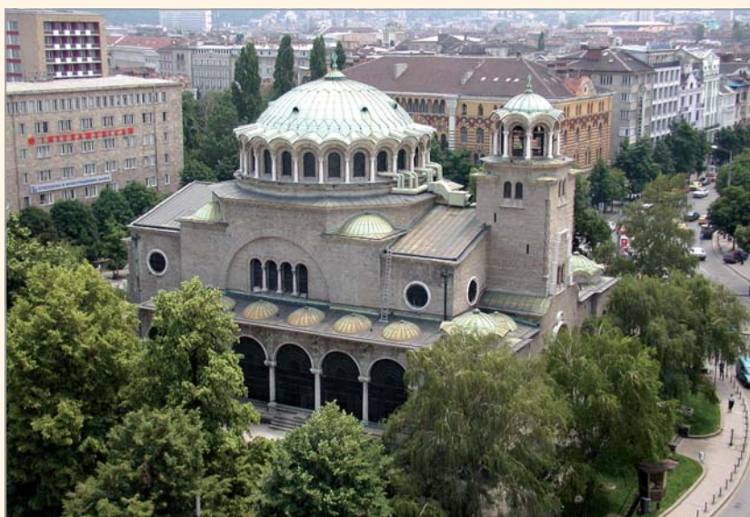
Днешен изглед на храма

Миналото на катедралния храм „Св. Неделя“ е забудено в неизвестност. Под него лежат основите на голяма по площ антична сграда. Едни от археолозите смятат, че това е преториум или президиум (т.е. военният съд на римския легион), а други – че основите на преториума са извън храма, а под него се намират руините на голяма римска баня. От започналите през лятото на 2015 г. археологически разкопки на площад „Св. Неделя“ проличава, че надделява второто мнение – тук е била голяма обществена римска баня.