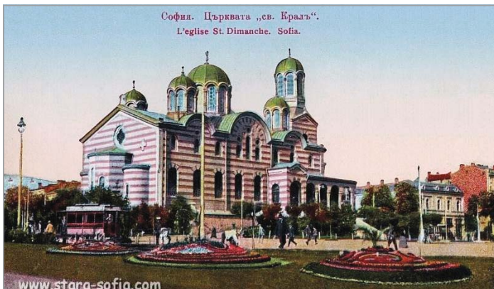
Пощенска картичка със съборния храм „Св. Неделя“ от началото на 20-те години на XX в.

Към 5,30 ч. тленните останки на Негово Блаженство бидоха спуснати в гроба при пение „Вечна памет“ и всички, дълбоко опечалени, хвърляха върху ковчегата пръст, като мълвяха: „Бог да го прости!“ и „Лека му пръст!“ До късно вечерта, както и на следните дни народ се стичаше на гроба да запали свещ и да се поклони на своя архипастир“.