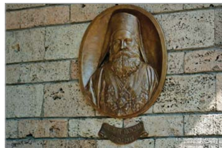
Бронзов барелеф на екзарх Йосиф I

ните и свещениците и се извърши опелото при пее на хора на г-н Николаев. До трона на Негово Величество Царя стоеше благоговейно Н.Ц. Височество Престолонаследникът, а зад него царската свита и генералитета. На ляво от ковчегата бяха дипломатическите представители, а зад високпресо-вешените синодни членове – министрите, бившите министри и други видни граждани. Когато хорът пееше песента „Св. святами упокой“, всички присъстващи коленничиха. При последното целуване пръв Престолонаследникът целуна ръка на Блаженопочиналия. Свето-Видинският митрополит Неофит и синодният протосингел архимандрит Стефан държаха надгробни сло-