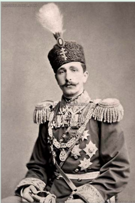
Княз Александър Батенберг

Вечерта градът бил илюминиран бялскаво. Особено удачно мила украсена общественията градина, светеща с хиляди разноцветни фенери. Срецу двореца се гиздел огромен транспарант, на който било написано: „На Освободителя на България, Александър Втори“. Имало и други транспаранти с вензели и многоз-