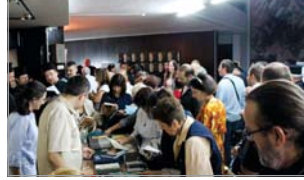
Интересът към православната книга не спира през цялата седмица

Митрополит Ион припомни на аудиторията, че във времето от 1992 г., когато о. Лонгин става настоятел на подворието на Троицко-Сер-