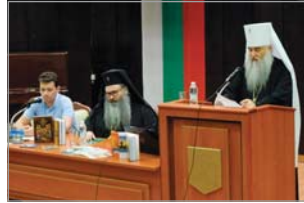
Саратовски и Волски митрополит Лонгин представя издателската дейност на епархията си

Това бе най-запомнящият се ден от форума. Публиката има възможността да се срещне с Не-