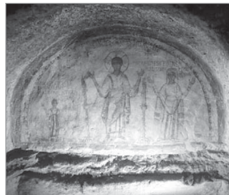
Най-старият образ на св. Януарий в катакомбата

Откъс от подготвената за публикуване книга „Съвременни чудеса в Църквата“