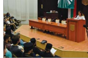
С представянето на новозелзетелски книги на Синаоднало издателство форумът бе закрит

След богословската конференция, посветена на светителя архиепископ Серафим Бугучерски (по-подробно виж на стр. 6), програмата в последния ден на Седмичната продължи в пленарната зала на Общината.