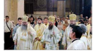
Архиепископско боосеужение в небозата при закриването на форума