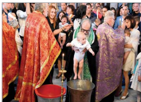
Плевенският митрополит Игнатий извършва тайнството св. Кръщение в гр. Плевен

След края на масовото кръщение Врачанският митрополит Григорий се обърна към всички в храма: