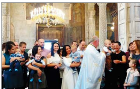
В гр. Бургас 50 деца станаха православни християни