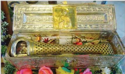
Св. мощи на св. прлчница Анастасия Римлянка, съхранявани в манастира „Григорит“ св. Гора – Атон. Църквата почита палметта и на 29 октомври