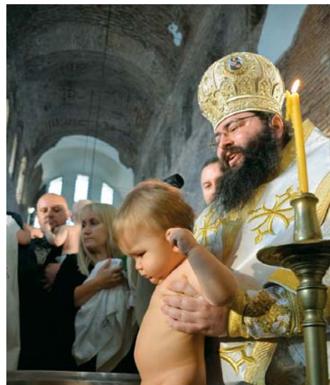
Пресвещеният Мелнишки епископ Герасим, гл. секретар на Св. Синод, извършва св. Кръщение в столичния храм „Св. София – Премъдрост Божия“ заедно с много софийски свещеници. Бяха кръстени над 170 деца.