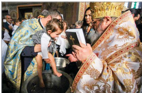
Великотърновският митрополит Григорий извърши св. Кръщение на 33 деца в катедралния храм „Успение Богородично“, гр. Велико Търново

Родителите споделиха, че са избрали да се включат в най-масштабното свето кръщение на новородени деца в съвременната история на България, защото така дават пример и насърчават раждаемостта.