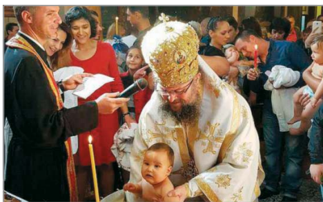
Св. Кръщение в катедралния храм „Св. Николай Мирликийски“, Враца