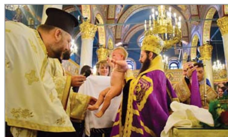
Пресвещеният Знеполски еп. Арсений по време на масовото кръщение в митрополитския храм, Пловдив