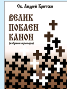
„Велик покаян канон“ Цена: 5,00 лв.