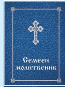
„Семеен молитвеник“ Цена: 4,00 лв.

Ползва се търговска отстъпка от 20% при закупуване на 10 и повече броя от едно издание.