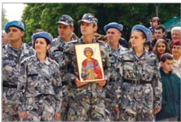
Бого и нашето название, угба и това усещане за пусотна, тревожност, ескалация агресивност, което унетвята човека и изцежда

Според нашите синодални архиепископи, „Европейският съд по правата на човека не може да налага на държавите обща рамка на поведение и законодателно отношение към основните църкви в държавите и символите на тези църкви“.