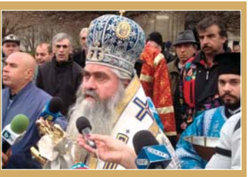
жизнените му сили.

Бого и нашето название, угба и това усещане за пусотна, тревожност, ескалация агресивност, което унетвята човека и изцежда