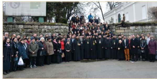
Текстове в броя: Александра КАРАМИХАЛЕВА

„Радвам се и съм благодарен на Бога, че ме е поставил да уча във вярата, да наставлявам и ръководя в пътя на спасението Божия народ във Видинска епархия. С радост приемам това послушание, съзнавайки голямата отговорност, множеството предизвикателства и трудности, които предстоят, но с упование в Божията помощ, единството и взаимопомощта на събратята от Светия Синод, другите сестри Поместни православни църкви, клира и църковното изпълнение служението ми да бъде богоугодно, за слава Божия и за наше общо спасение“ – каза митрополит Даниил и заключи: „Нека с Божията помощ и по молитвите на св. Димитрий и честваните днес светии да преинемем предстоящия ни подвиг! Божие благословение да бъде с всички нас! Амин!“