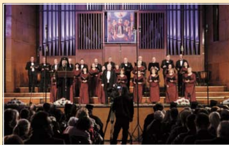
Смесен хор при ПКСХП „Св. Александър Невски“

Възрожденски песни повдигнаха патриотичния дух у нас – Смесения хор при изпълнението на песента „Де е България“ се включиха всички участници в