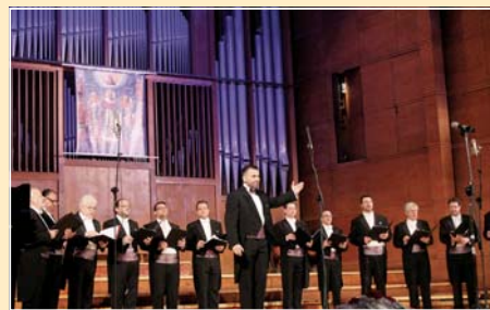
Камерен ансамбъл „Св. Йоан Кукузел-Ангелогласния“