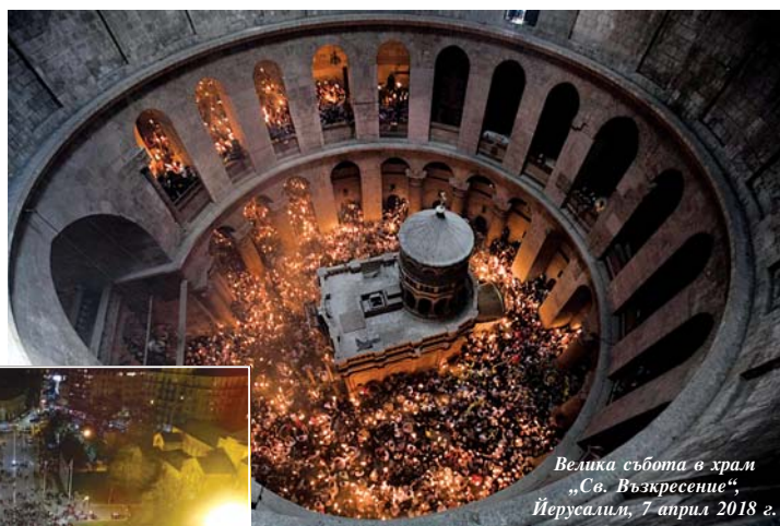
Велика събота в храм „Св. Възкресение“, Йерусалим, 7 април 2018 г.

Животът и вярата, които светата Църква изповядва и проповядва, и с които всички нейни верни живеят и се спасяват, са божествен дар за всички нас и за всеки човек; живот, който е „в изобилие“ (Йоан. 10:10), и вяра – която побеждава „света“ (1 Йоан. 5:4) и всичко онова, което е „от света“ (Йоан. 15:19) и не е угодно Богу. Вяра, чрез която вярно намираме пътя Господен – пътя към Небесата и към вечния живот в лоното на Отца. Защото с тази вяра, както свидетелства и апостолът, ние „ходим, а не с виждане...“ (2 Кор. 5:7), и с нея по благодат