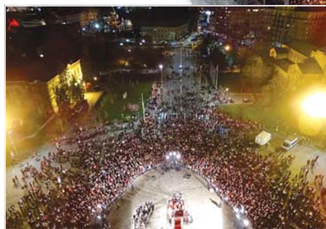
Пасхалната нощ на площад „Св. Александър Невски“

ки, повелява: „Никой да не оплаква своята бедност, защото Царството небесно е отворено за всички! Никой да не плаче за своите грехове, защото от гроба на Спасителя изгря опрощение! Никой да не се бои от смъртта, защото Спасовата смърт ни освободи от нея!“ (Похвално слово за Пасха). И заедно с апостола пита: