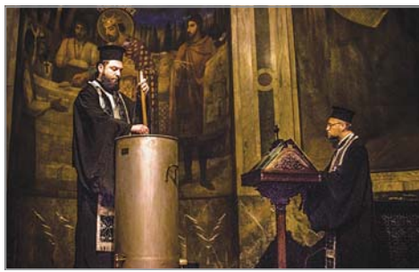
Мироварене при четене на Свещ. Писание