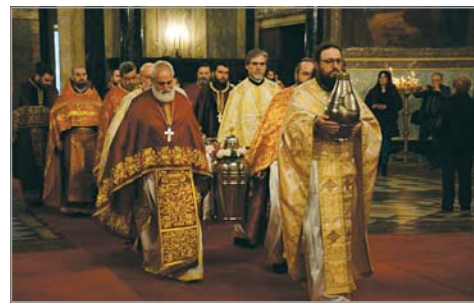
Великият вход на св. Литургия при мироосвещаването