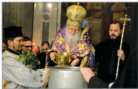
Велики понеделник – освещаване на водата за мироваренето