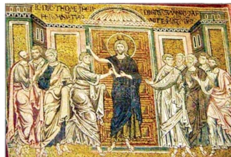
Стенопис от катедралата „Рождество на Пресвета Богородица“, Монреал, Сицилия