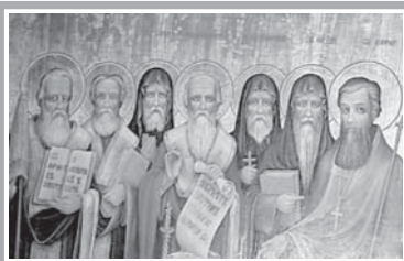
ЦЪРКВА И ОБЩЕСТВО

ен либерализъм съдържа и едно полярно противоположно отношение на разума и Вярата, противопоставяне на Църквата и държавата, на религията и светската кул-