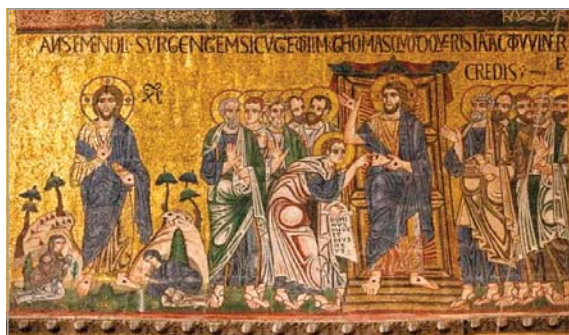
Мозайка от базиликата „Сан Марко“, Венеция

Сцената „Уверението на Тома“ заема основно място в православната иконография. Друг важен елемент, който винаги присъства, е заключената врата. От една страна, тя изобразява евангелския разказ – „Доиде Исус,