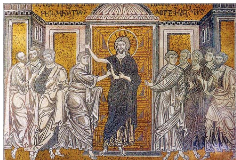
Мозайка от манастира Хора, XIV в., Истанбул

Ирина Языкова. „Икона Уверение Фомы“; Лазарев В. Н. „История византийской живописи“