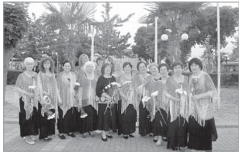
Хорът „Благовестие“ – домакин на фестивала

Техните изпълнения внимателно се прослушаха от членовете на фестивалния секретариат (музикално жури), с председател Негово Високопреосвещенство митрополит Киприан, като след това Всеки хор