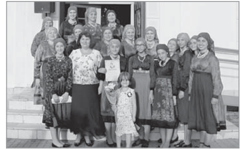
Хорът от бесарабски българи „Чешма варуита“, Украйна