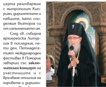
Сливенски митрополит Йоанкиев споделя радостта си от музикалния форум

церта разговаряше с митрополит Киприан, диригентите и певците, като споделише възторга си от изпълнението им.