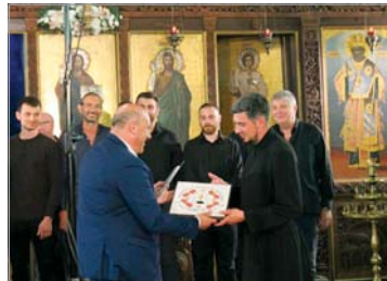
Връчване отличия на хорете и диригентите

Фестивалните концерти завършиха с изпълнения на Сборна хорова формация, която тази година бе най-многобройна. През последните години се наложи добрата