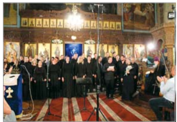
Хор при Старозагорската държавна опера