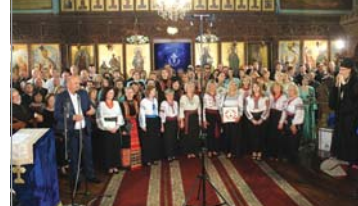
Момент от заключителния концерт

„Св. ап. Павел казва, че една е светлината на слънце, друга е светлината на месечината, трета е светлината на звездите, а и звезда от звезда се различава. Много се погръхотне, но и голяма награда получихте, защото музиката достига най-дълбоко, до човешкото сърце... Ценим поезията, ценим литературата, но музиката стига до най-тънките струни на нашата душа. Тя ос-