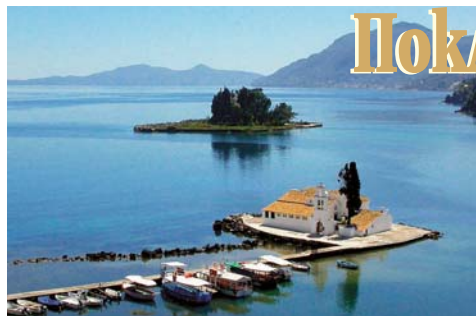
Остров Понтикониси и манастир „Св. Богородица Влахернска“