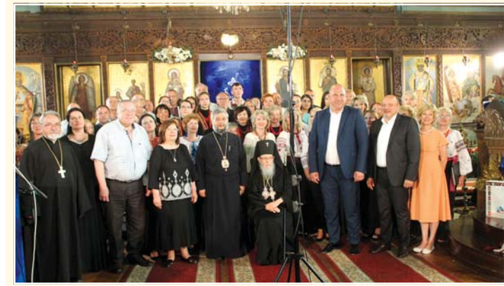
Паметна снимка при закриването на фестивала