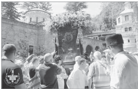
Тържествена лития с чудотворната икона