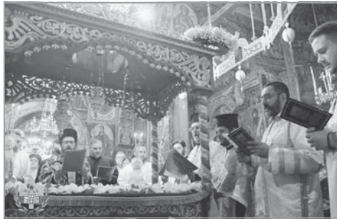
Опело на Пресвета Богородица

Да почетат голямата Богородичен празник, многохилядни поклонници непрестанно прииждаха в манастира, като се радваха на молитвеното богослужение, покланяха