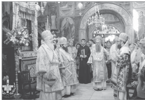
Начало на празничната утрешня