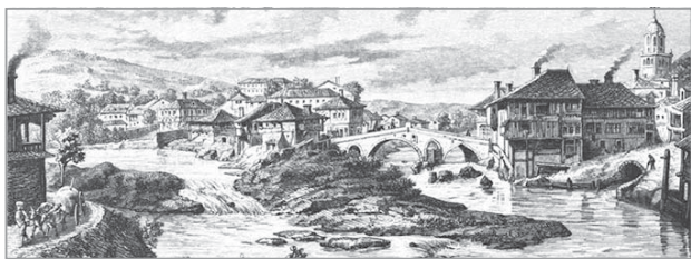
Габрово през 1871 г., графика от Феликс Каниц

Дамаскин – църковен сборник с поучителни слова и жития по името на първия автор на подобно четиво – гръцкия писател от XVI в. Дамаскин Студит.