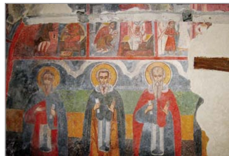
Фрагмент от средновековния стенописен пласт

Третият етап на църквата се свързва с Късното