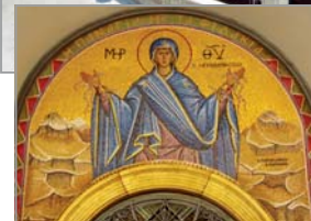
Църквата със змийките – „Успение Богородично“

ки змийчета, чиято кожа е като кадифе, на челата и езичетата си имат кръстен знак, а очите им са искрящи и блестящи. Тяхната поява се приема като велика Божия милост и знак за безмерната любов и грижа на Бога и Божията Майка към страдащото човечество. Те се появяват на 6 август – Преображение Господне, и изчезват на 15 август – Успение Богородично. Ако не се появят, това веща беда, вярват хората. Така, когато не се появили през годините 1940 и 1953-та, островът бил сполетан от разрушителни земетресения.