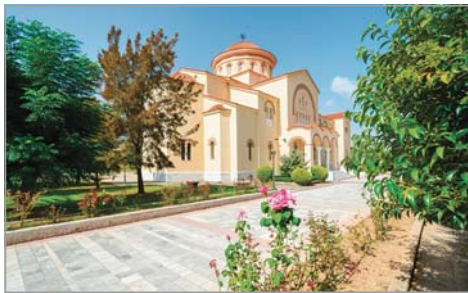
Манастирът с мощите на св. Герасим Кефалонийски

Манастирът е женски, с голям двор – с големи дървета магнолии, които цъфтят с красиви бели цветове, и пишци яркочервени храсти богенвилля. Мощите на светеца (цялото му нетленно тяло) е в позлатена рака в дясно, до южната страна на църквата, пред олтара. Много чудеса са ставали при неговите нетленни мощи, за които се говори, че са като на жив човек.