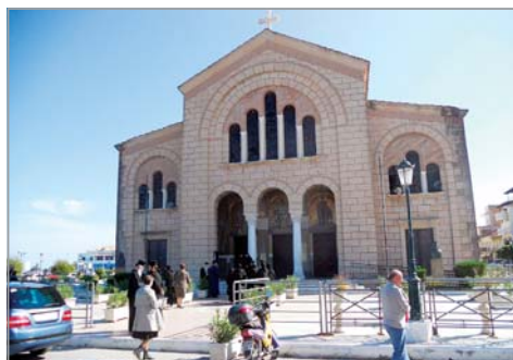
Храмът с мощите на св. Дионисий