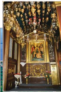
Иконата, закрилница на о. Лейфада, в манастира „Св. Богородица Фанеромени“

Лейфада първоначално е бил полуостров, но изкуствено е прокопан канал за улесняване на корабплаване