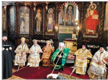
та на Светия Дух осветен. Нека Бог да даде този храм наистина да бъде радост и утеха за всички, които ще влязат в него. Блх искал да благодарят на всички, които са допринесли за възрождането на тази величествена катедрала“ – каза в словото си той.

„С Божията милост в 109-ата годишнина от построяването и освещаването на храм „Св. Николай Мирликийски Чудотворец“, той отово да благослови онеия бълг, който наистина предици са възлюбил за неговата благоусрещна и духовен живот, И така, с Божията помощ, чрез молитвите на всички ви, този храм отново беше възроден и с благодат-