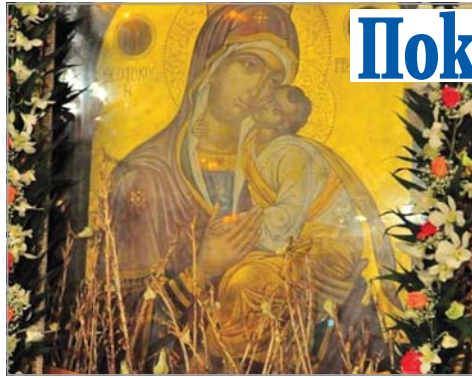
Икона „Св. Богородица Гравалиотиса“